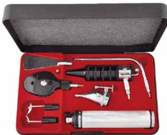
902-0410 DIJAGNOSTIČKI SET, EKONOM, GOWLLANDS