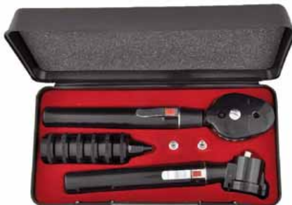
902-0440 DIJAGNOSTIČKI SET, COMPACT, GOWLLANDS